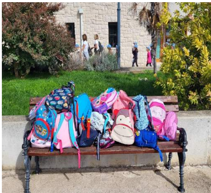
Za to vrijeme ruksaci su na sigurnom

12. listopada nas je posjetila pjesnikinja Vesna Štulić koja živi u Ninu a po majci je Cukrov iz Prvić Šepurine. Vesna piše poeziju, prozu i romane a došla nam je u posjet po inspiraciju za