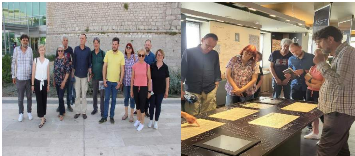
II. Dani Ive Brešana u organizaciji GK Vodice

27. svibnja smo ugostili sudionike II. Znanstvenog kolokvija Dani Ive Brešana u organizaciji Gradske knjižnice Vodice. Naš poznati dramski pisac i scenarist Ivo Brešan rodio se 27. svibnja 1936. godine u Vodicama u kojima je kratko boravio do preseljenja u Šibenik. S Prvića smo se uputili u Šibenik gdje smo u HNK-u posjetili Brešanovu sobu.