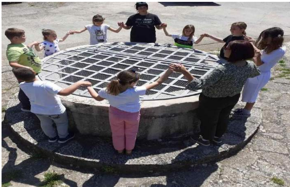
Učenje osnova zlarinskog kola u sklopu 27. Edukativne-muzejske akcije na temu Ples

→ Međunarodni dan muzeja , 18. svibnja, besplatni ulaz za sve posjetitelje