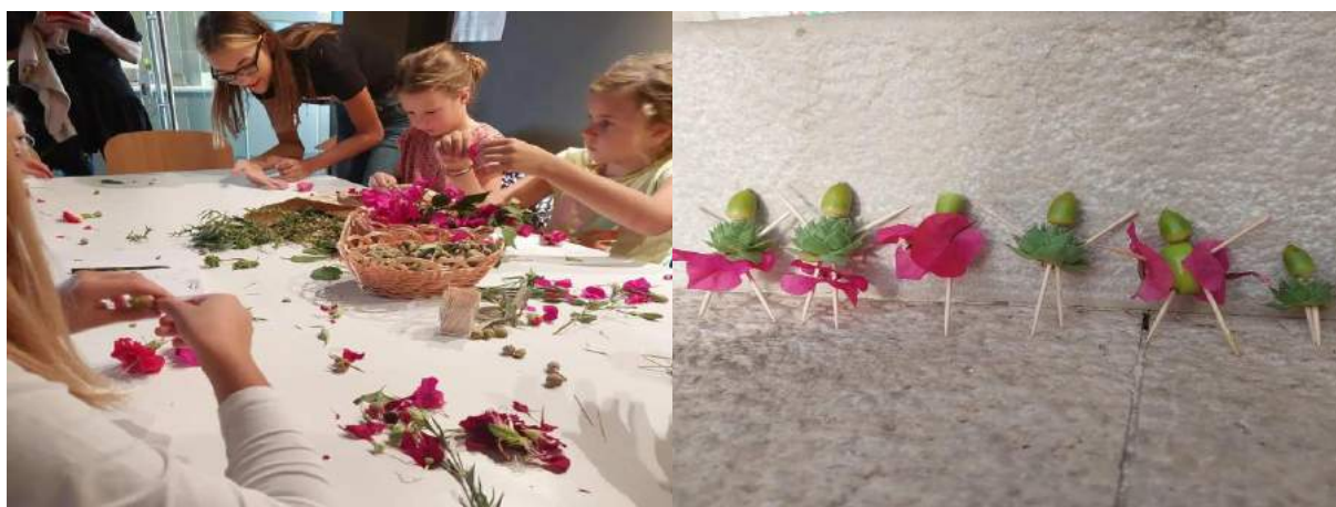
Radionica u sklopu 10. KDFV-a

Ove godine jubilarni 10. Kreativni dani su bili najzanimljiviji i najkreativniji (po našem skromnome mišljenju 😊) do sada. Bilo je mnogo događanja, radionica, predavanja, predstava i druženja. Kod nas u Centru održana su slijedeća događanja i to 08. listopada u subotu u 16:30h započela je radionica za djecu "Vile žirice i vilci žirci" dok je u 17:30h naša Zlatka održala predavanje pod nazivom "Priča o rakiti". Nakon Zlatke dr. sc. Damir Viličić održao je u 17:30h predavanje pod nazivom "Hrast crnika – simbol izgubljenih šuma".