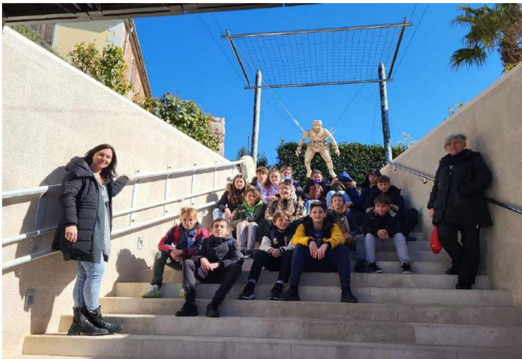
6. b Osnovne škole "Fausta Vrančića" iz Šibenika

Marljive šestaše je zanimalo što je Faust jeo svojedobno i koliko se hrana razlikovala od današnje, da li su plemići i pučani imali isti meni, koji priborom su se služili sve do zanimljivih pitanja poput riječi iz Faustovog Rječnika koje se tiču prehrane te da li su se koristili isti izrazi za namirnice kao danas. Inače, ova vrijedna ekipa je već lani započela istraživati našeg velikana u projektu "Faustovima stopama" pa smo tako imali prilike surađivati s njima u njihovoj online nastavi nakon čega su posjetili vođenu turu "S Faustom po Šibeniku".