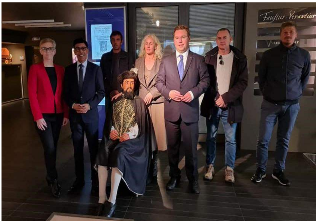
Posjet predsjednika Regionalnog odbora za razvoj EU parlamenta Younousa Omaarjeea

I u ovoj godini sudjelujemo u projektu IQM Destination Vodice kojeg provodi Turistička zajednica Grada Vodica. IQM Destination je projekt integralnog upravljanja kvalitetom u destinaciji. U sklopu projekta online se mjeri reputaciji poslovanja te kvaliteta usluge i proizvoda kao jedan od alata za upravljanje destinacijom. Ukupna ocjena kvalitete našeg Centra u 2022. je 94.71/100. Za usporedbu u 2021. bila je 94.3/100.