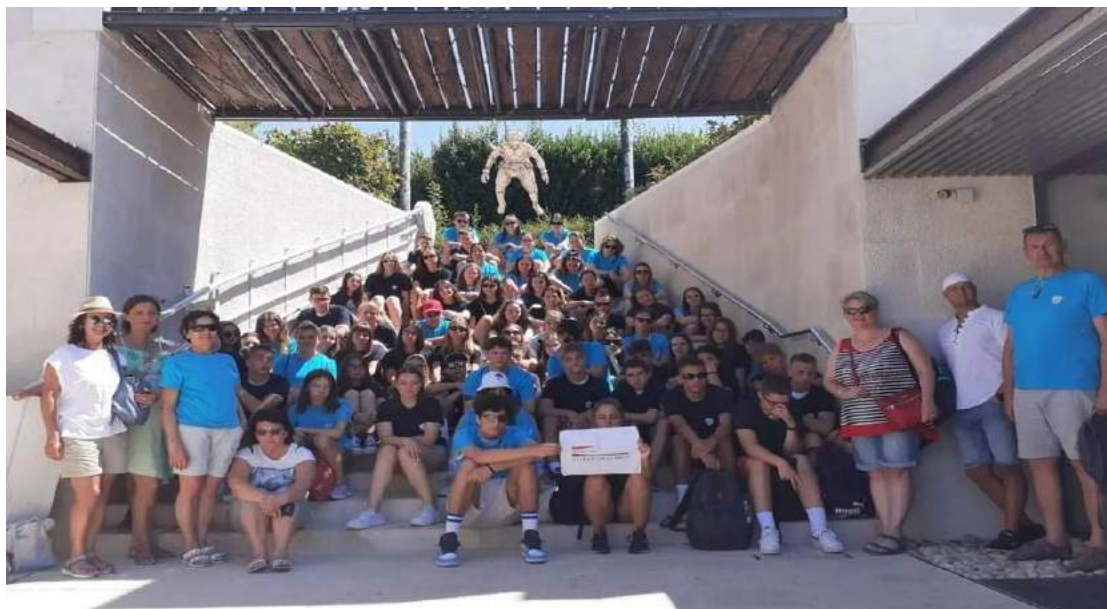
Učenici i nastavnici hrvatskih škola u Mađarskoj u posjetu našem Centru

06. srpnja u posjet su nam došli učenici i nastavnici hrvatskih škola u Mađarskoj: Gimnazije Karolya Kisfaludyja iz Mohača, Hrvatske osnovne škole i gimnazije iz Budimpešte i Hrvatske osnovne škole Miroslav Krleža iz Pečuha. Učenici su u Hrvatskoj bili smješteni na Pagu u sklopu ljetnog kampa.