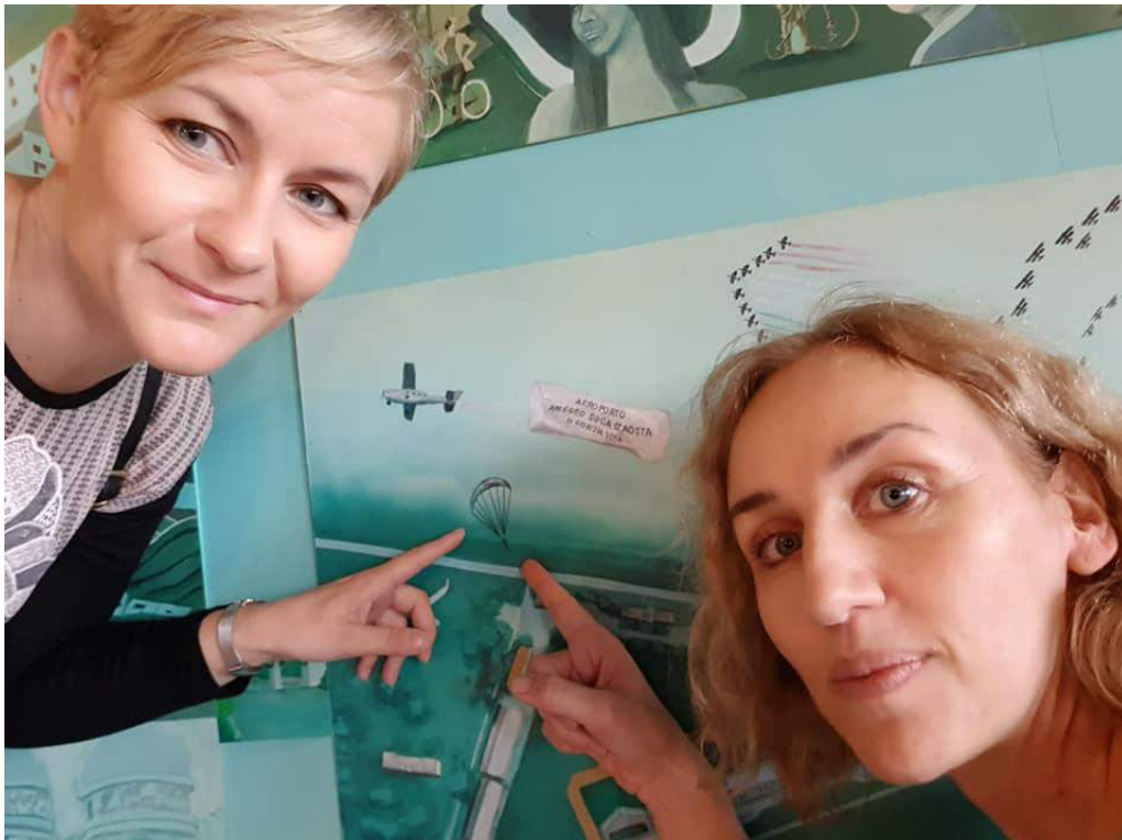
Ne možeš dalje od posla 😊