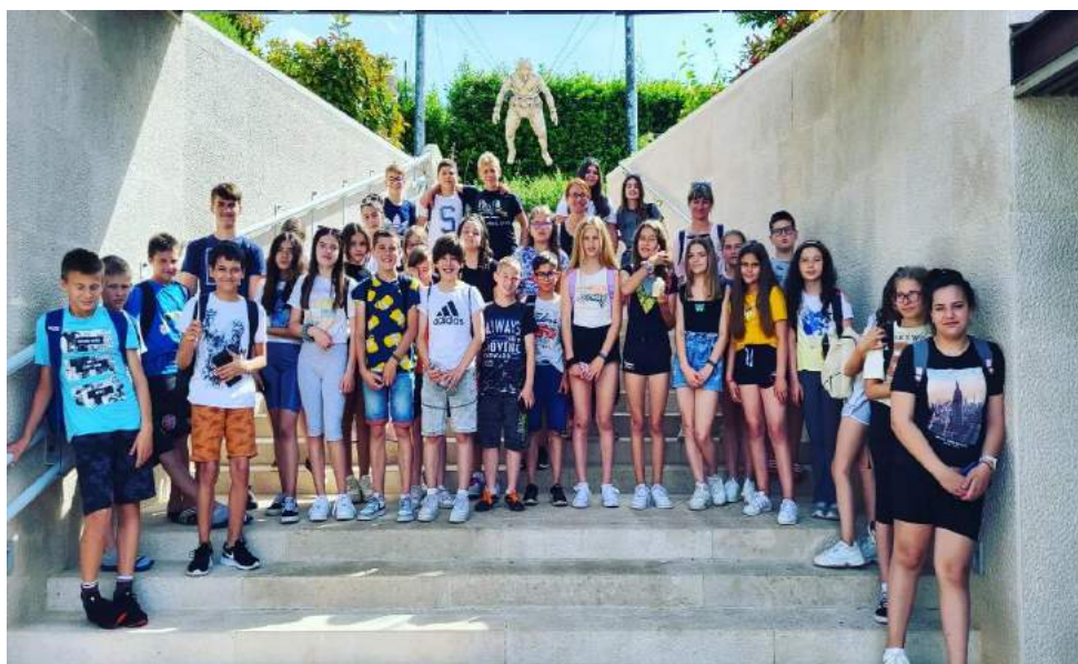
Školarci iz OŠ Čista Velika poziraju na našim stepenicama