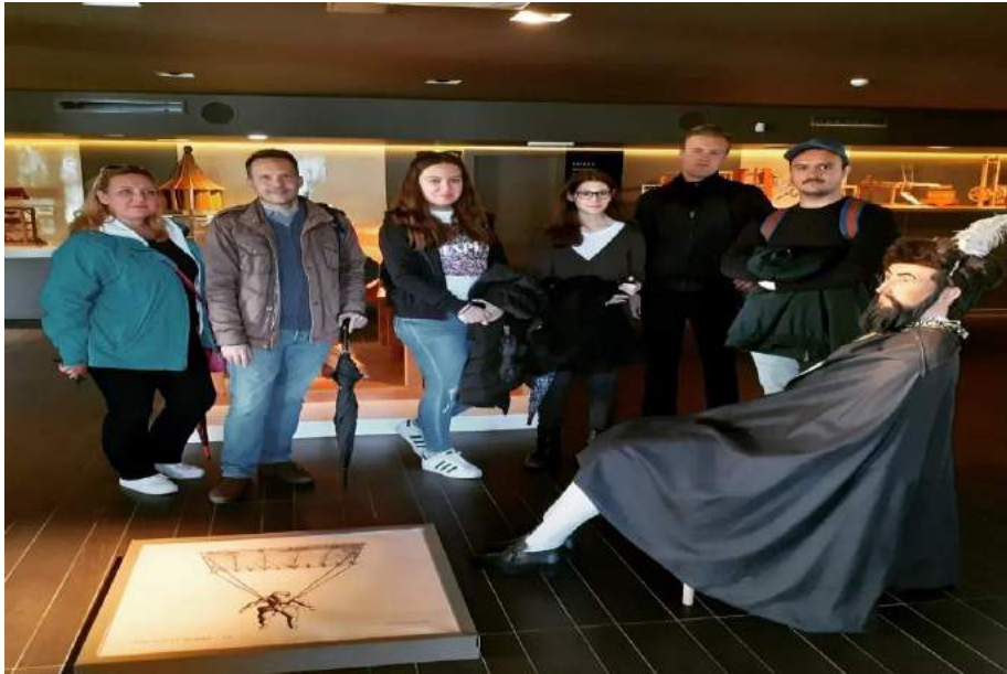
Izvrsni studenti muzeologije sa svojim profesorima s riječkog Filozofskog fakulteta