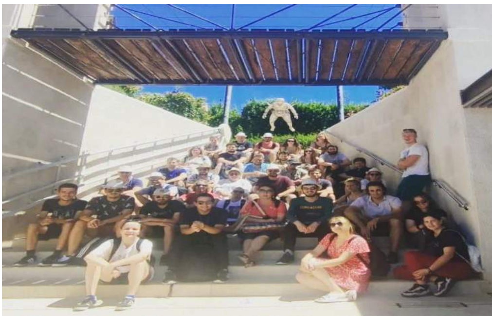
Studenti zagrebačkog Filozofskog fakulteta na terenskoj nastavi

18. lipnja posjetili su nas studenti Filozofskog fakulteta u Zagrebu u sklopu terenske nastave kolegija Srednjovjekovne utvrde u Hrvatskoj i zbirke povijesti knjižnice. Studenti su bili smješteni u novouređenoj Tvrđavi sv. Ivana u Šibenik.