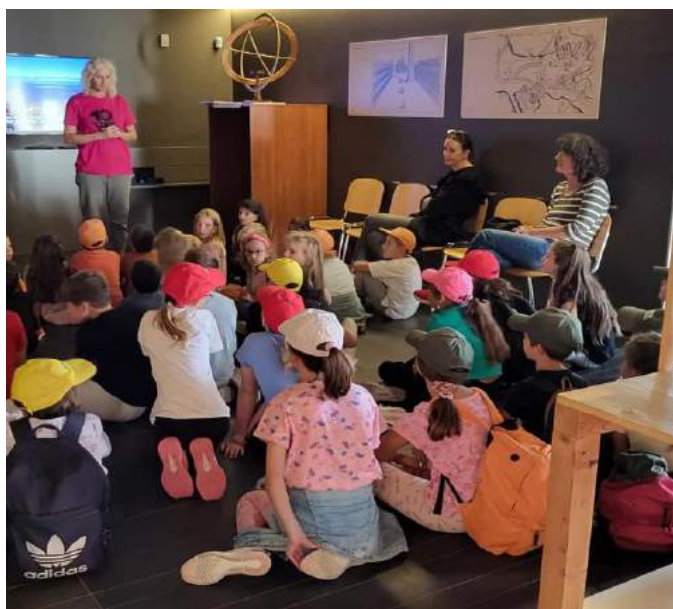
Pažljivo se sluša i sudjeluje u razgovoru