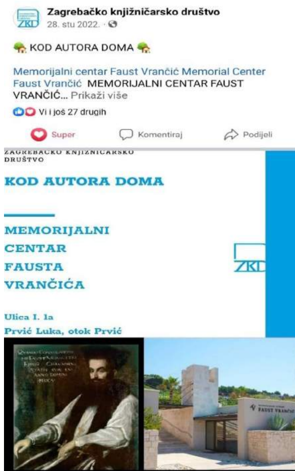
Predstavljanje našeg Centra na Facebooku Zagrebačkog knjižničarskog društva

U sklopu službenog trodnevnog posjeta Republici Hrvatskoj posjetio nas je predsjednik Odbora za regionalni razvoj Europskog parlamenta sa sjedištem u Strasbourgu, gospodin Younous Omarjee sa svojim suradnicima. Delegacija je kroz jutro 05. prosinca u pratnji delegacije Grada Šibenika posjetila Tvrđavu Barone i sv. Ivan te Kuću umjetnosti Arsen u Šibeniku gdje je predstavljena Rezoluciju EU parlamenta o otocima i kohezijskoj politici. Nakon Šibenika posjet je nastavljen prema Zlarinu gdje je prezentiran projekt Hrvatskog centra za koralje koji se trenutačno provodi i sufinancira europskim sredstvima.